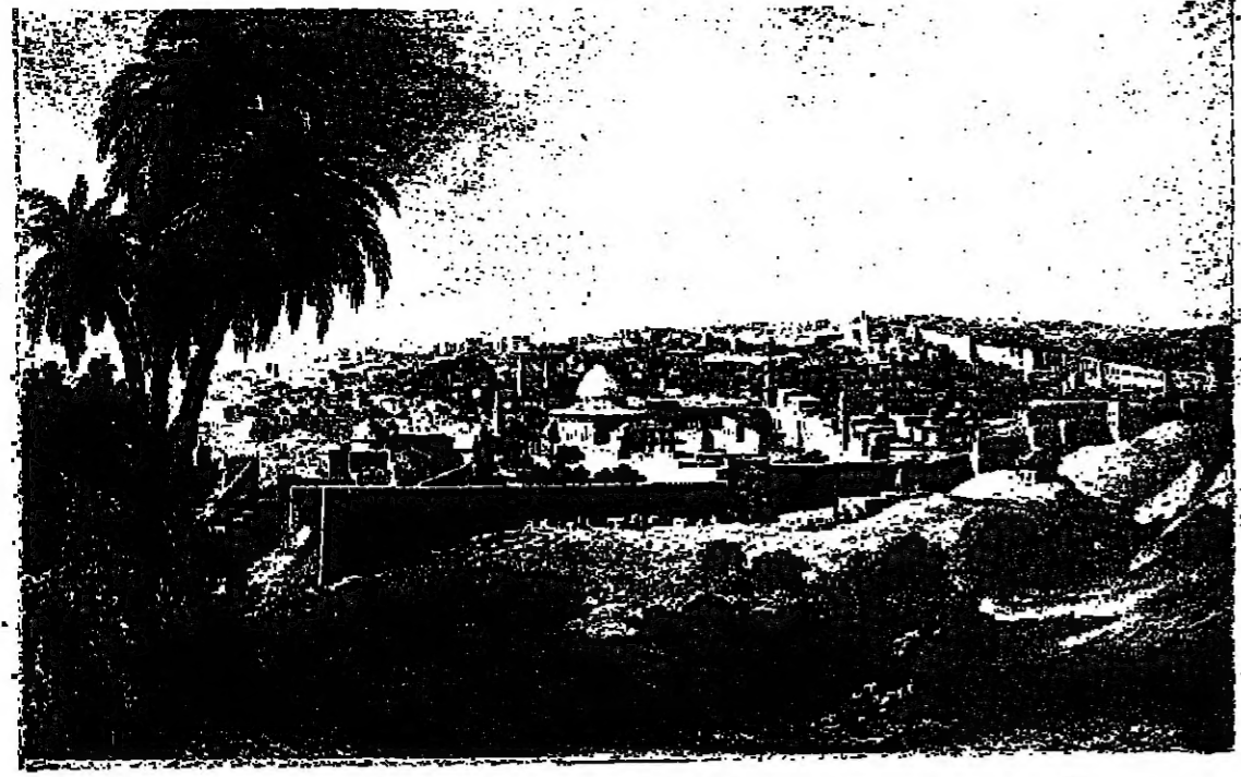
بيت المقدس ، من الجهة الشرقية . كما تراحت لابن بطوطة اثناء زيارته لها .